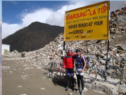
Khardung La (5.602m)