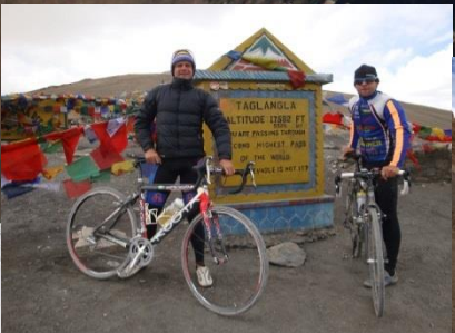
Taglang La (5.328m)