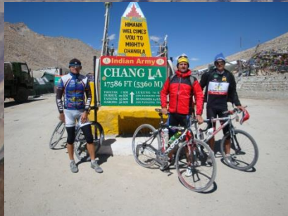
Chang La (5.360m)