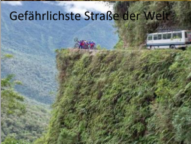
Gefährlichste Straße der Welt