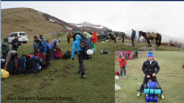
Start Gergeti's Sameba (2.200m)