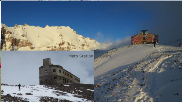
Meto Station (ca. 3.680m)