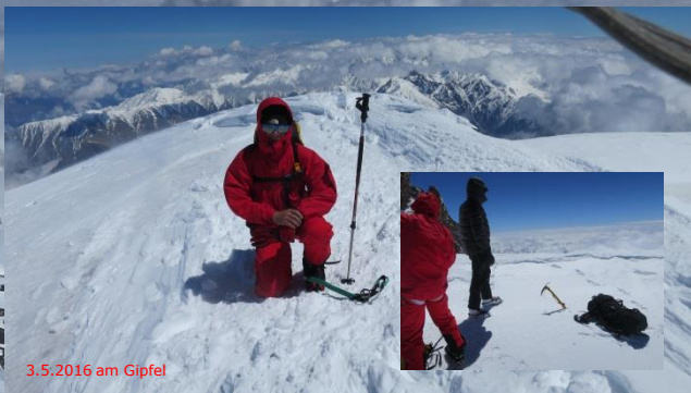
3.5.2016 am Gipfel