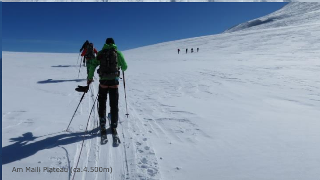
Am Maili Plateau (ca. 4.500m)