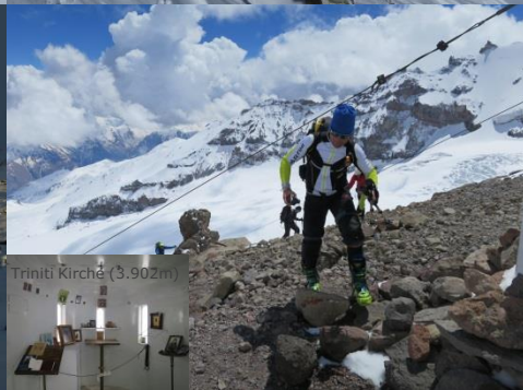
Trinité Kirché (3.902m)