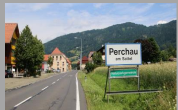
Perchauer Sattel (996m)