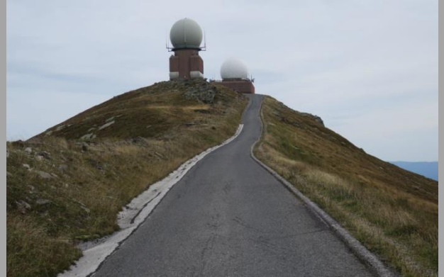
Gr. Speik (2.140m)