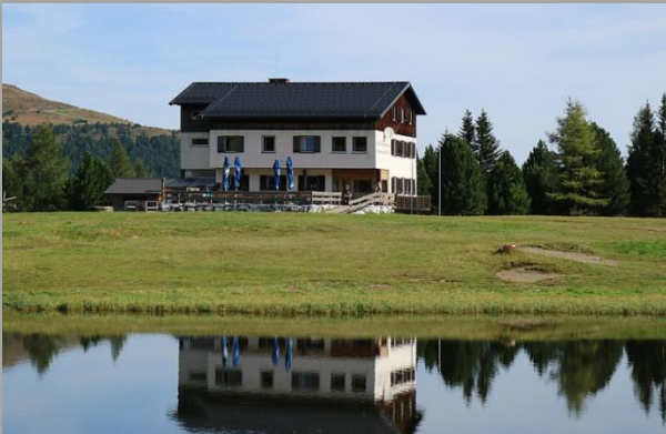
Winterleiten Hütte (1.800m)